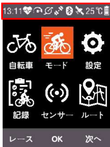
ステータスバーの説明