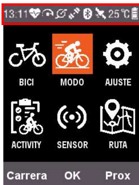
Descripción de la barra de estado