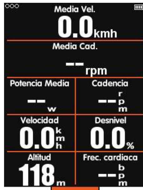
Modo de conducción